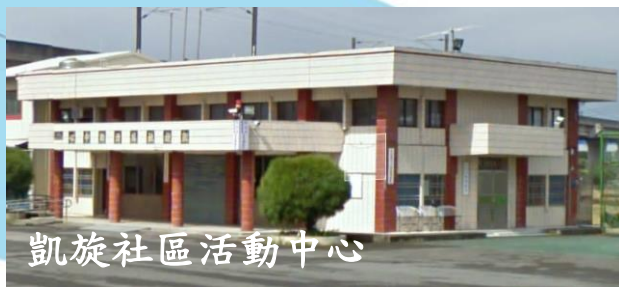
凱旋社區活動中心